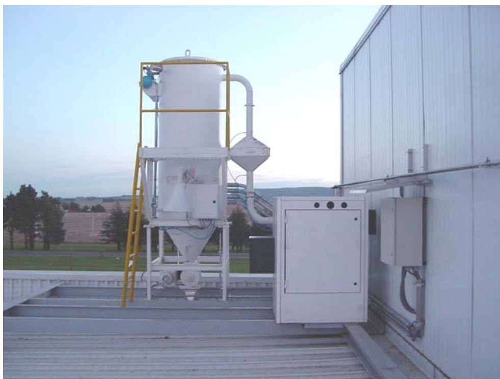
Aspiración Por Alto Vacío Ciclo-Filtro