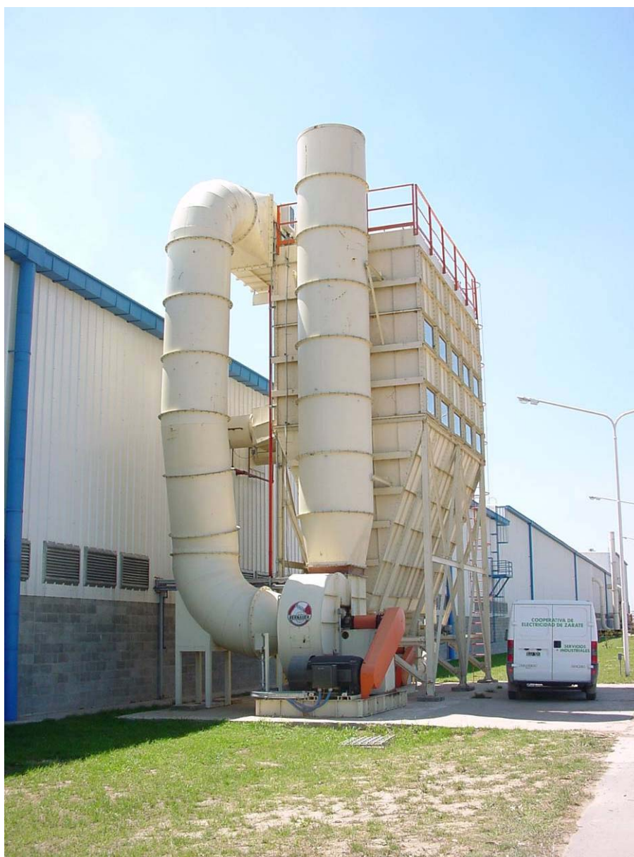
Ciclones Filtros y Conductos de Transporte Neumático Industria Maderera – Fabrica de Aglomerados