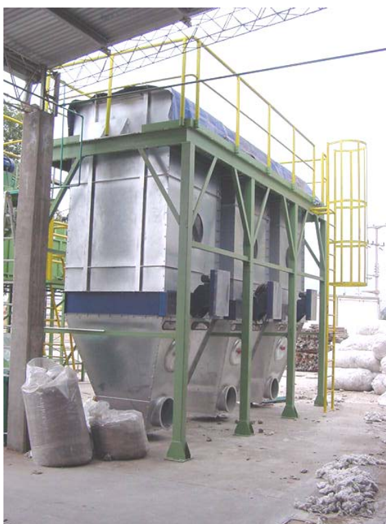
Conductos de Transporte Neumático y Silos de Desperdicios Industria Textil