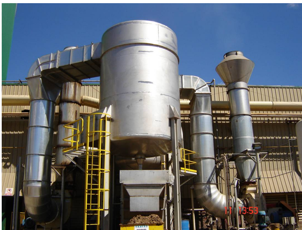
Aspiración de Vahos Salida de Prensa Continua Industria Maderera – Fabrica de Tableros Aglomerados y MDF

Rommel Talleres Metalúrgicos S.A.I.C.I.A. Peralta Ramos 4886 - (B1616GCB) Pablo Nogués - Bs. As. - Argentina - Tel.: (54-11)4463-0030 - Fax(54-11)4463-1760 e-mail: info@rommel.com.ar TECNOLOGIA DEL AIRE Y EL MEDIO AMBIENTE