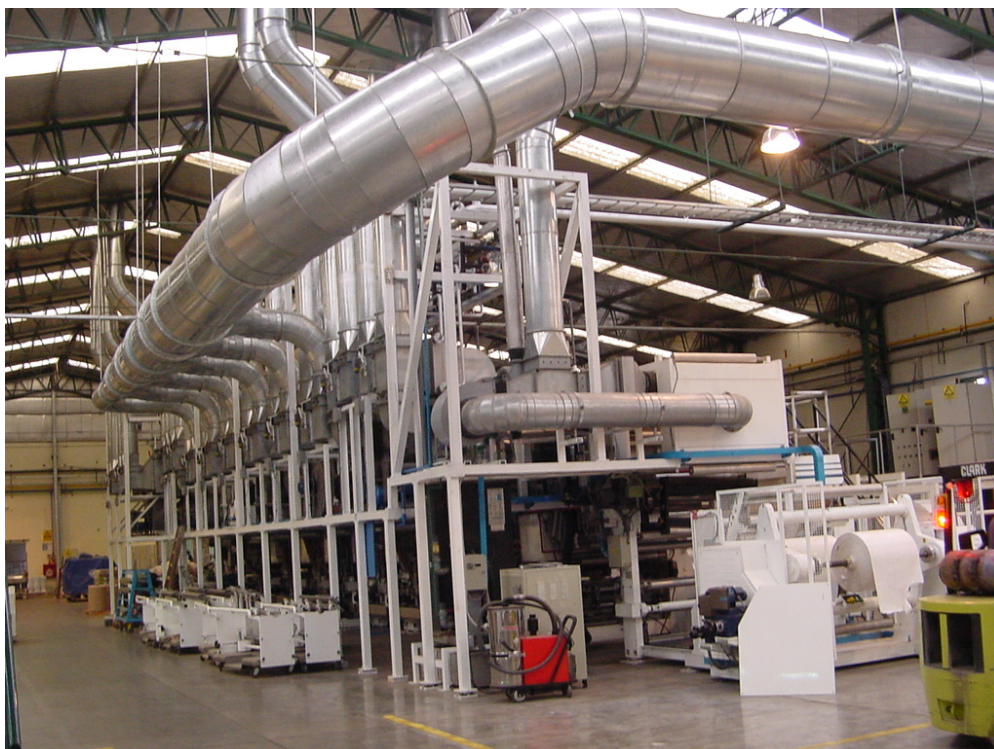
Aspiración de solventes – Industria Grafica