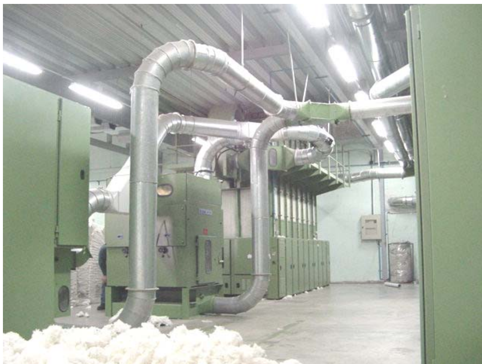
Conductos de Transporte Neumático de Fibras Industria Textil