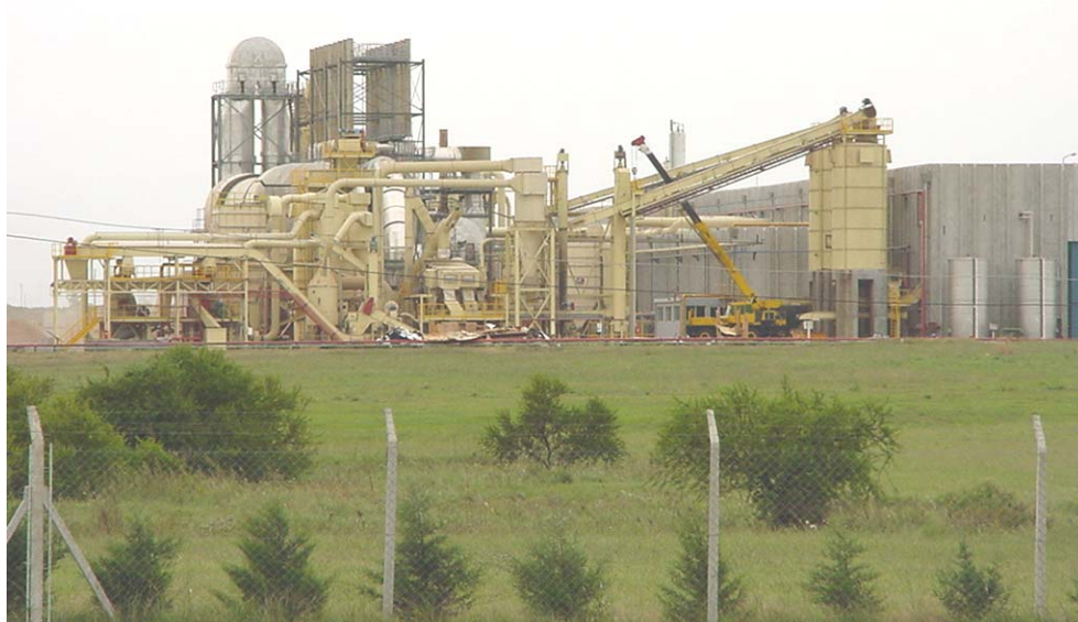
Ciclones Filtros y Conductos de Transporte Neumático Industria Maderera – Fabrica de Tableros Aglomerados y MDF