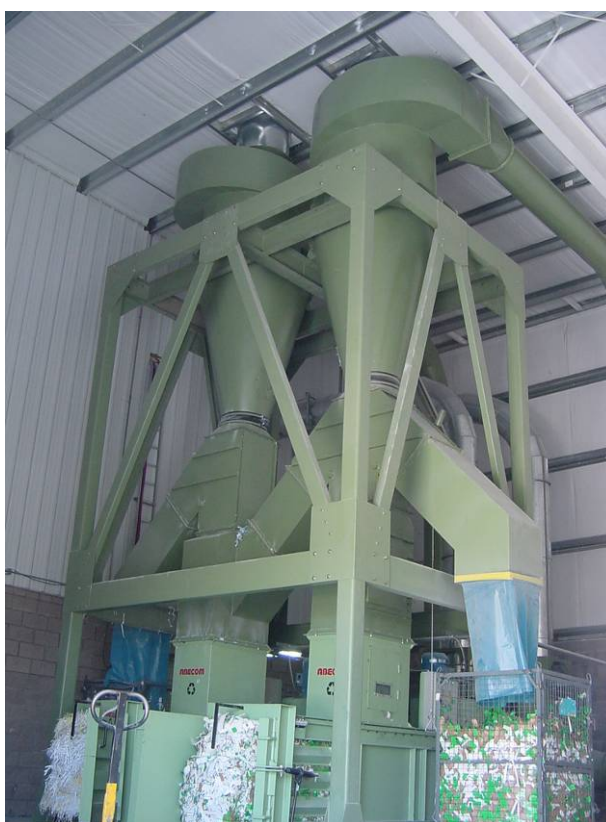
Aspiración Transporte y descarga de Refile Industria Grafica

Rommel Talleres Metalúrgicos S.A.I.C.I.A. Peralta Ramos 4886 - (B1616GCB) Pablo Nogués - Bs. As. - Argentina - Tel.: (54-11)4463-0030 - Fax(54-11)4463-1760 e-mail: info@rommel.com.ar TECNOLOGIA DEL AIRE Y EL MEDIO AMBIENTE